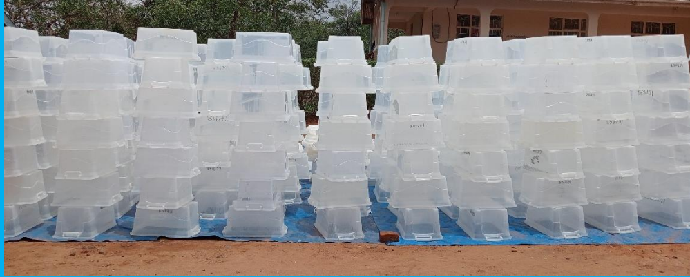
Masanduku ya kura yakiwa tayari kwaajili ya Uchaguzi wa Serikali za Mitaa Novemba 27 2024