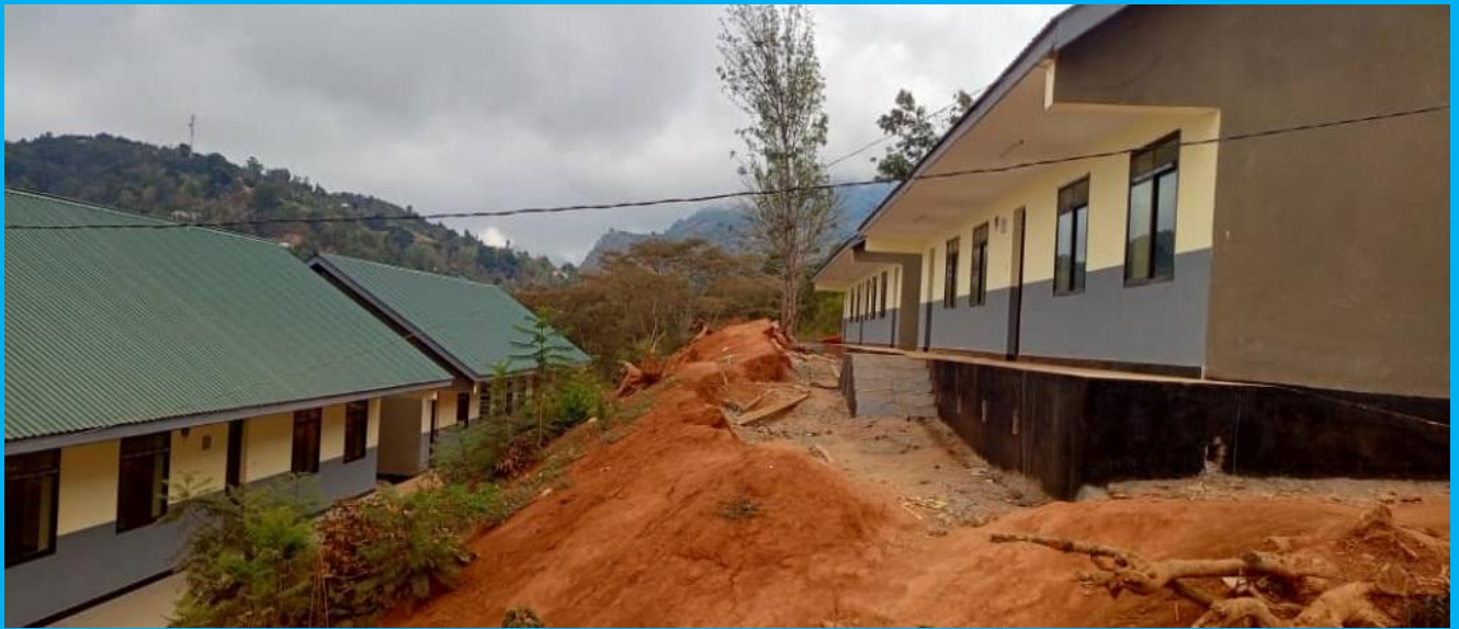
Mradi wa Ujenzi wa Shule mpya ya Sekondari Malindi Kata ya Suji ukiwa katika hatua za umaliziaji

Halmashauri ya Wilaya ya Same imetumia Shilingi Bilioni 14 kutekeleza miradi mbalimbali ya Maendeleo kwa mwaka wa fedha 2023/2024 ambapo kati ya fedha hizo bil 2.4 zilikuja nje ya ukomo wa bajeti.