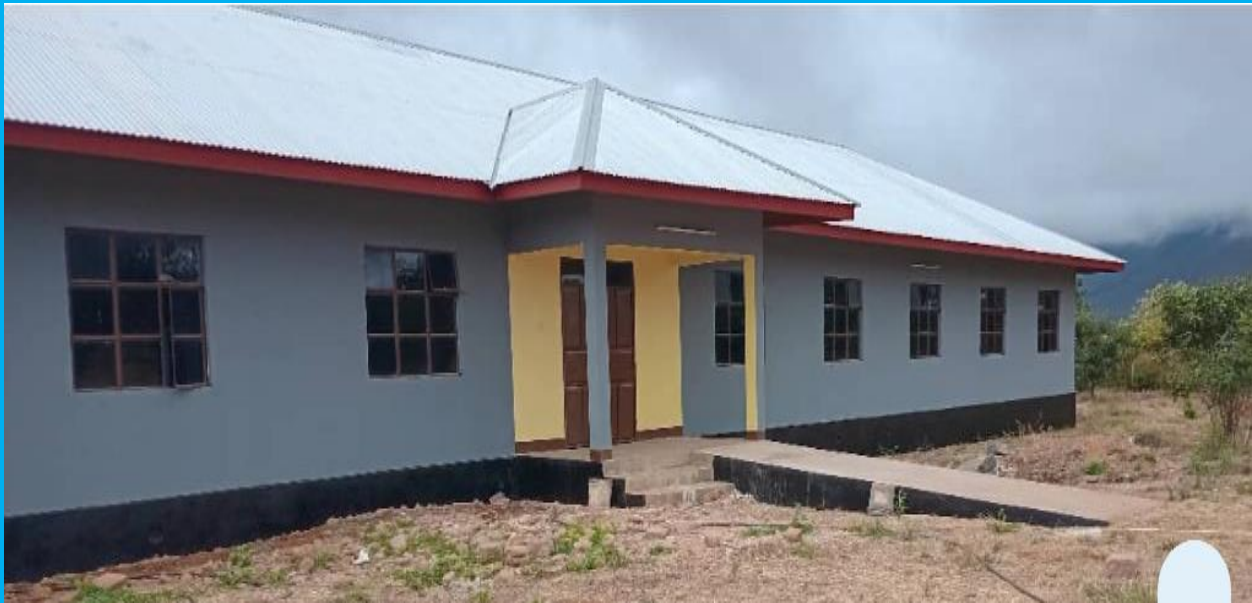
Bweni la Shule ya Sekondari Kibacha likiwa kwenye hatua ya umaliziaji

Kamati ya fedha, Uongozi na Mipango ya Halmashauri ya Wilaya ya Same imetembelea na kukagua Miradi ya Ujenzi wa mabweni matatu kwenye Shule za Sekondari za Kibacha na Makanya ambapo ilieleza kuridhishwa na maendeleo ya ujenzi.